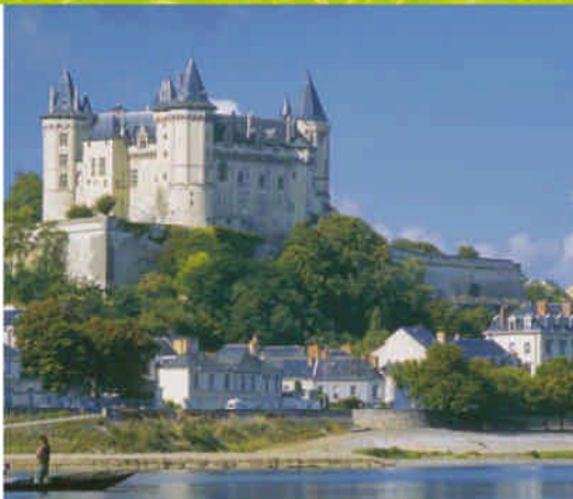
Château de Saumur.

Les hommes qui ont courtoisé très tôt les rives du fleuve ne s'y sont pas trompés. Princes, artistes, maîtres d'équitation, pèlerins, vigneron et mariniers ont ouvert la voie aux cavaliers, randonneurs et cyclistes d'aujourd'hui. Mêmes gestes, mêmes plaisirs vécus à quelques siècles d'intervalle.