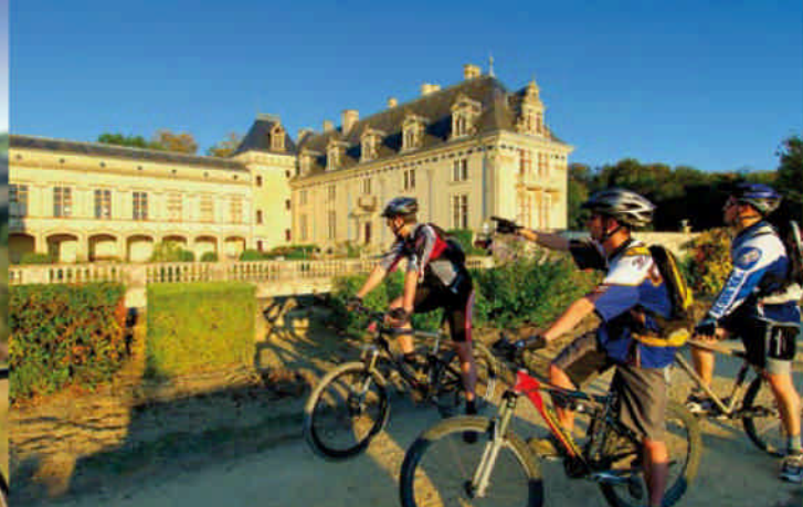
Château de Brézé