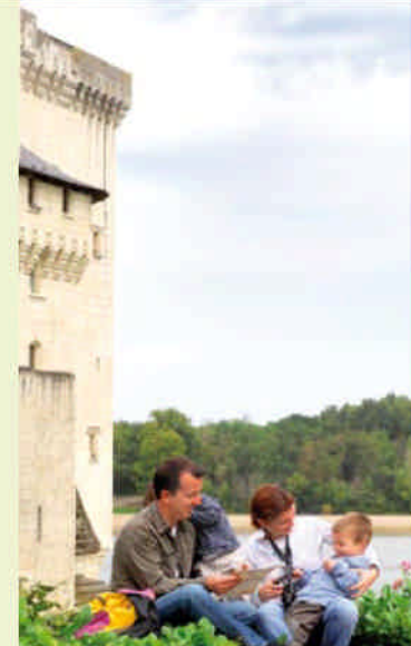
Château de Montsoreau

À Saint-Hilaire-Saint-Florent, où les eaux du Thouet rejoignent celles de La Loire, les amateurs de balades à vélo emprunteront alors La Loire à Vélo, un itinéraire cyclable où plus de 150 km sont réservés à la bicyclette, entre Tours et Angers.