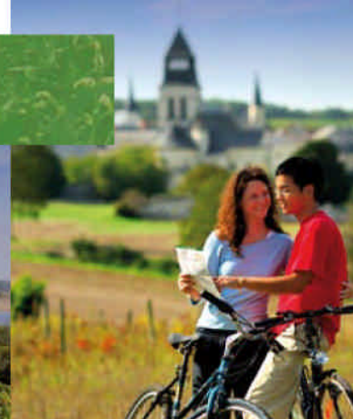
Abbaye royale de Fontevraud.