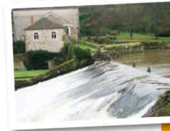
La Forge à Fer

D'ici vous bénéficierez d'un point de vue original et magnifique sur la vallée du Thouet.