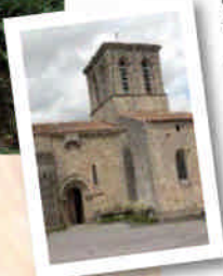
Église de la Peyratte

Vous arriverez ensuite à Parthenay par le lieu-dit «les Terres Rouges», puis aurez une vue imprenable sur le quartier historique de St-Jacques.