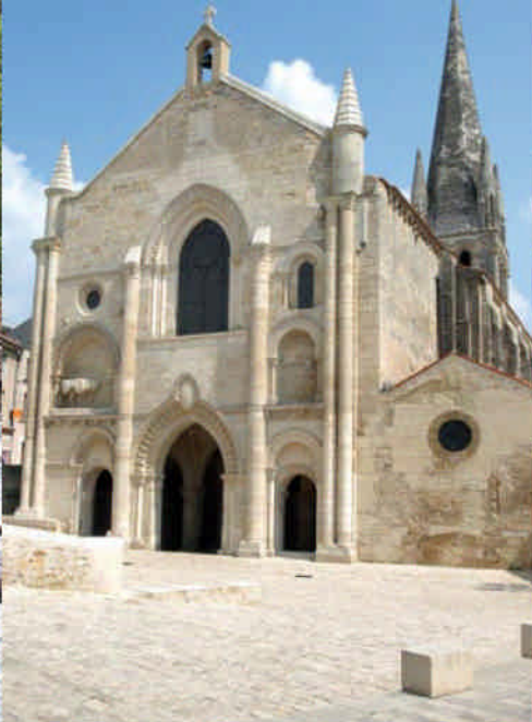
Abbatale St-Pierre En page de gauche : le Thouet à Airvault.

Airvault, son église abbatiale, son centre médiéval... à vélo ou à pied