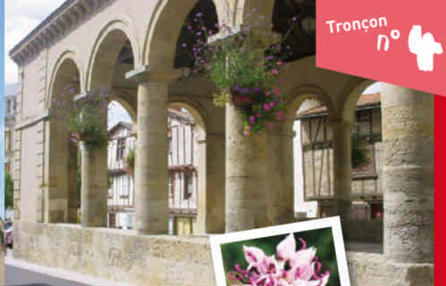
Au centre d'Airvault, les Halles