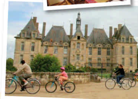
Le château de St-Loup, une escale obligatoire !