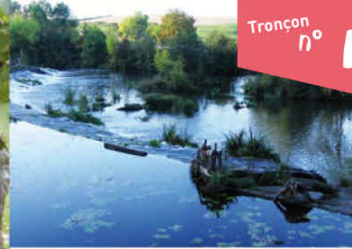
Chaussée du Moulin de Crevant

Les vignobles du Thouarsais (sachez les apprécier et les consommer avec modération). En page de gauche : Plan d'eau de la Ballastière, St-Martin-de-Sanzay.