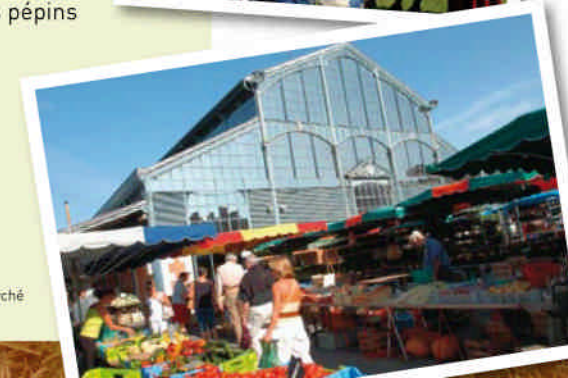
Niort, le Marché des Halles.